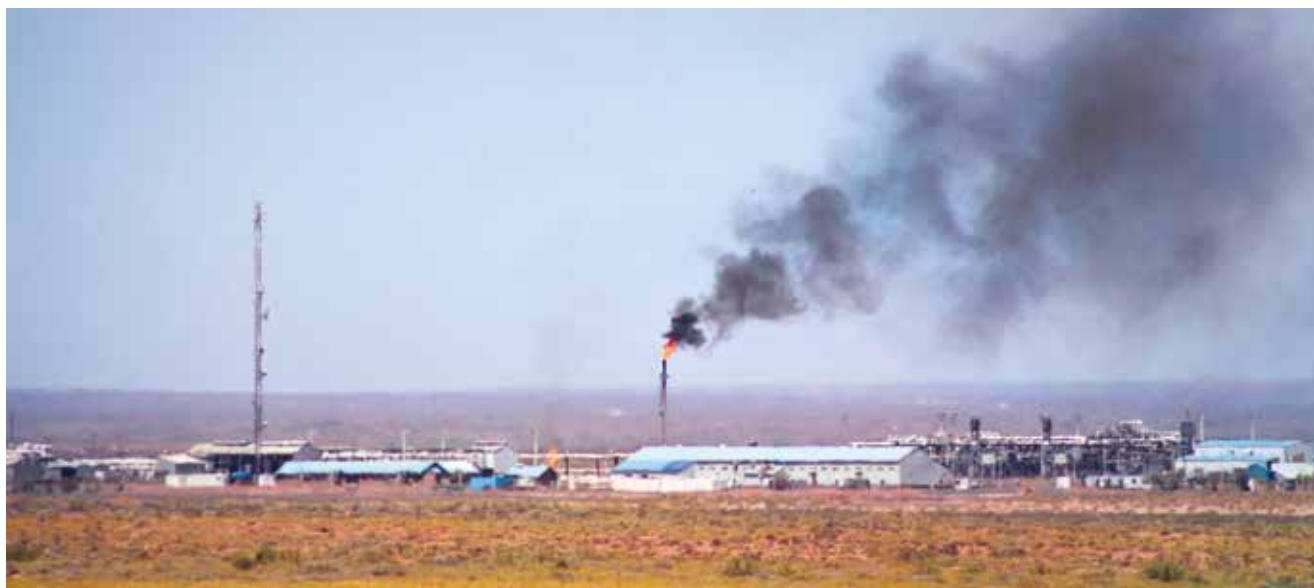
Martín Álvarez Mulally

Planta de hidrocarburos en el bloque San Roque, Provincia de Neuquén. Total opera el bloque; a PAE – BP le pertenece el 16.5%