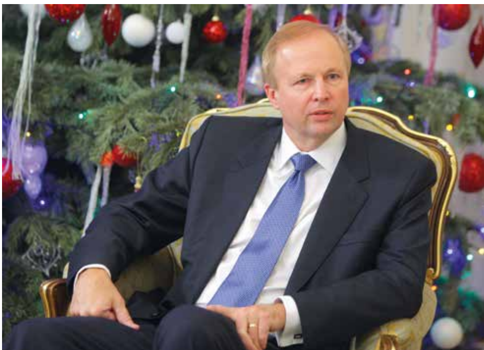
CEO (director) de BP Bob Dudley

BP se conoce por ser responsable de la mayor catástrofe de vertido de petróleo de este siglo, que se produjo en las profundidades marinas del Golfo de México en 2011. El pozo de petróleo Macondo explotó, incendiando la plataforma petrolera y matando a 11 trabajadores. El pozo, que BP intentó taponar sin éxito en varias ocasiones, vertió petróleo al océano durante 89 días, creando una mancha de 10.000 metros cuadrados de extensión y dañando por varias décadas los bancos de peces y crustáceos de los que dependían miles