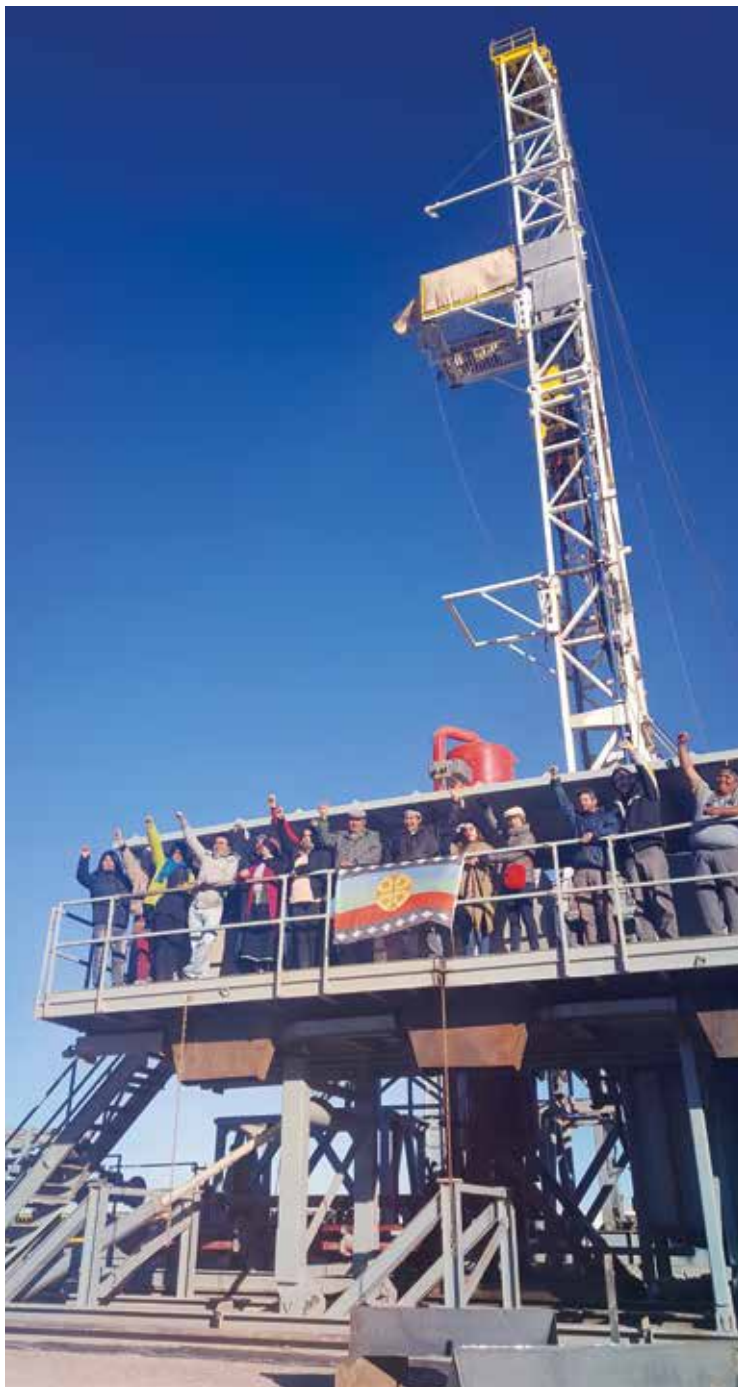
La comunidad mapuche Lof Campo Maripe bloquea una torre de perforación en su territorio

Desde el punto de vista del futuro de BP y el